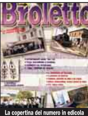
La copertina del numero in edicola

Su «Broletto» gioielleria da regine dalla Sicilia al Lario