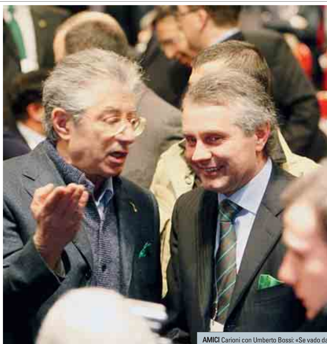
AMICI Carioni con Umberto Bossi: «Se vado da lui? Non vi deve interessare»