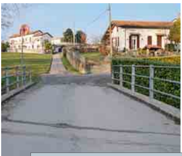
CIAVET L'area in cessione appartiene a questa zona