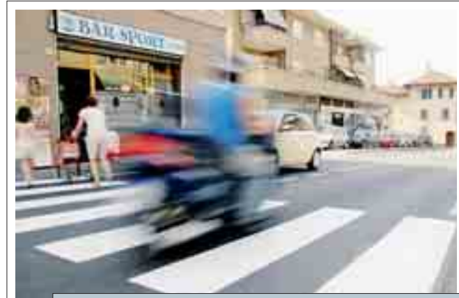
MENO TRAFFICO Il Comune vorrebbe pedonalizzare il centro